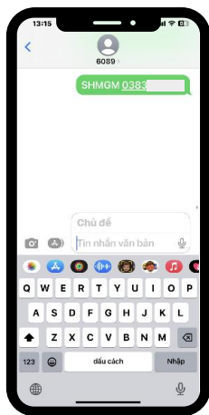
Người giới thiệu gửi SMS đến 6089

SHMGM<khoảng cách>[SỐ ĐIỆN THOẠI NGƯỜI ĐƯỢC GIỚI THIỆU]