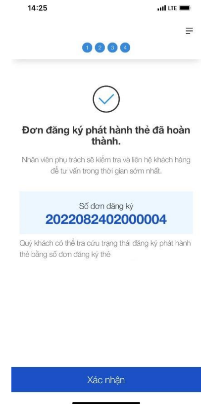
Bước 4: Mở thẻ thành công