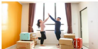
Ngân hàng Shinhan luôn sẵn sàng đồng hành cùng khách hàng hoạch định mọi kế hoạch tài chính cá nhân

Bên cạnh sự hỗ trợ, đồng viên từ gia đình và nguồn lực nội tại của bản thân, hầu hết chúng ta đều cần một đội tài chính để giúp lên kế hoạch, cảm nhắc những giải pháp phù hợp và đồng hành trên suốt hành trình mà đôi khi kéo dài đến cả 20 năm. Ngân hàng TNHH MTV Shinhan Việt Nam (Ngân hàng Shinhan) - ngân hàng hàng đầu tại Hàn Quốc và là ngân hàng nước ngoài hàng đầu tại Việt Nam hiện nay, chính là một đội tài chính như thế.