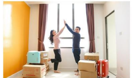
Ngân hàng Shinhan luôn sẵn sàng đồng hành cùng khách hàng hoạch định mọi kế hoạch tài chính cá nhân

Cũng như các cầu thủ luôn cần đồng đội bên cạnh để có một chiến thắng rực rỡ, bạn không thể đơn độc trên hành trình hiện thực hóa ước mơ. Bên cạnh sự hỗ trợ, đồng viên từ gia đình và nguồn lực nội tại của bản thân, hầu hết chúng ta đều cần một đối tác tài chính để giúp lên kế hoạch, cân nhắc những giải pháp phù hợp và đồng hành trên suốt hành trình mà đôi khi kéo dài đến cả 20 năm. Ngân hàng TNHH MTV Shinhan Việt Nam (Ngân hàng Shinhan) - ngân hàng hàng đầu tại Hàn Quốc và là ngân hàng nước ngoài lớn nhất tại Việt Nam hiện nay là một đối tác tài chính như thế.