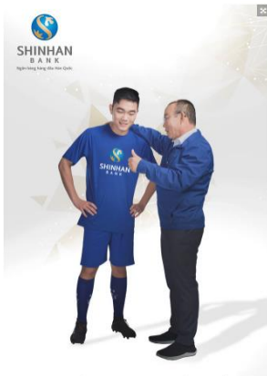
HLV Park Hang-seo (trái) và đội trưởng Lương Xuân Trường đang gặp gỡ trò chuyện với các cầu thủ ở sân tập.

Vấn đề bây giờ của bóng đá Việt chỉ còn nằm ở câu hỏi đầy trăn trở của ông Park: "Chúng ta đã sẵn sàng cho mục tiêu lớn chưa?".