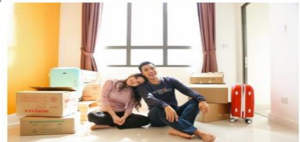
Ngân hàng Shinhan luôn sẵn sàng đồng hành cùng khách hàng hoàn thiện mọi kế hoạch tài chính cá nhân.

Cũng như các cầu thủ luôn cần đồng đội bên cạnh để có một chiến thắng rực rỡ, bạn không thể đơn độc trên hành trình hiện thực hóa ước mơ. Bên cạnh sự nỗ lực, đồng viên từ gia đình và nguồn lực tài chính của bản thân, nếu một chúng ta đều cần một đội tác tài chính để giúp lên kế hoạch, cân nhắc những giải pháp phù hợp và đồng hành trên suốt hành trình mà đôi khi kéo dài đến 20 năm. Và Ngân hàng TNHH MTV Shinhan Việt Nam (Ngân hàng Shinhan) - ngân hàng hàng đầu tại Hàn Quốc và là ngân hàng nước ngoài lớn nhất tại Việt Nam hiện nay, chính là một đội tác tài chính như thế.