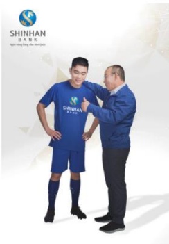
HLV Park Hang Seo và đội trưởng Lương Xuán Trường đang gặp gỡ chuẩn bị cho các giải đấu sắp tới

"Như từ từng chia sẻ, mục đích của tôi khi đến Việt Nam là muốn đóng góp một phần nhỏ vào sự phát triển của bóng đá Việt Nam bằng những triết lý, bí quyết, kiến thức về bóng đá của bản thân mình. Trong thời gian qua, tuy đạt một số kết quả nhất định, nhưng chúng tôi không bao giờ hài lòng với thành quả hiện tại. Tôi và các cầu thủ sẽ nỗ lực hết sức mình để có thể đóng góp vào việc xây dựng nền tảng cho sự phát triển của bóng đá Việt Nam, dù chỉ là từng chút, từng chút một", vị chiến lược gia Hàn Quốc cho biết.