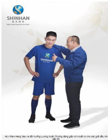
HLV Park Hang Seo và đội trưởng Lương Xuân Trường đang chuẩn bị cho các giải đấu sắp tới.